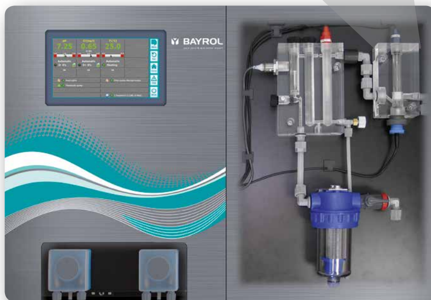
Vue en coupe

Vous souhaitez traiter l'eau de votre piscine de la même manière que dans les piscines publiques ? Rien de plus simple avec le PoolManager® PRO. Il mesure la concentration de chlore en mg/L pour une qualité parfaite de l'eau de piscine. Ça, c'est vraiment PROfessionnel.